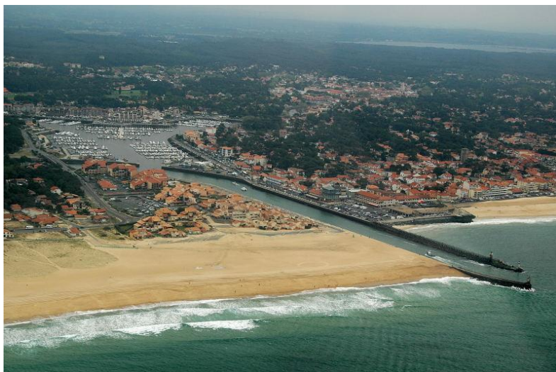
Document 4 : Photographie aérienne oblique du port de Capbreton.