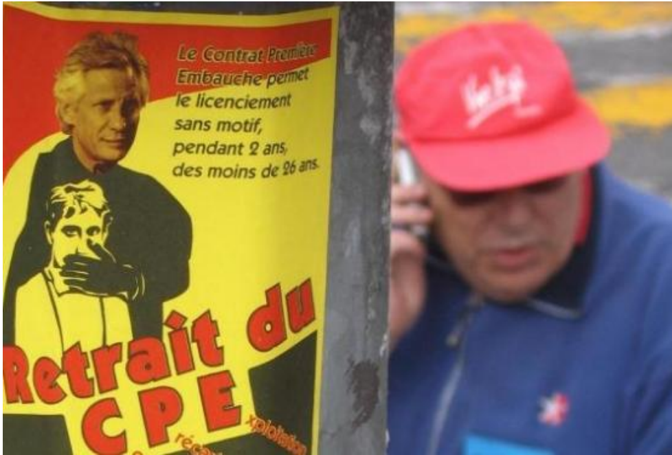
Document 2 : Cliché pris pendant les manifestations anti-CPE (Paris, 2006).

Paris, palais de l'Élysée — 31 mars 2006.